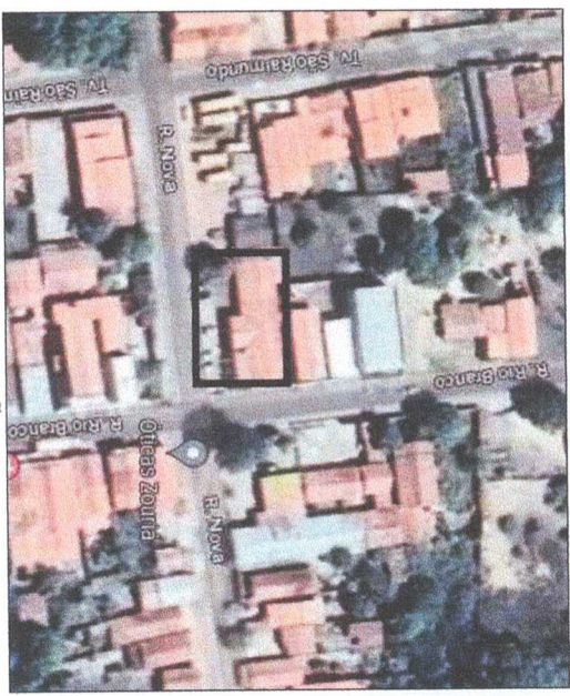
LOCALIZAÇÃO/SITUAÇÃO SEM ESCALA